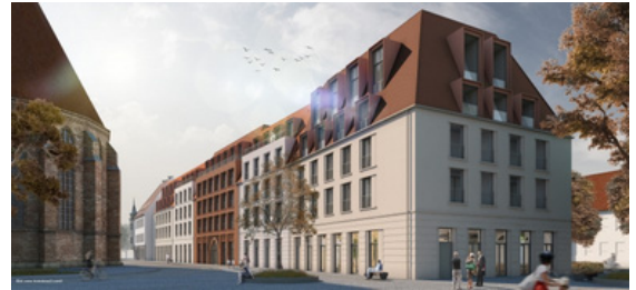
Marienkirchblick Große Oderstraße 25 2400 0005 3-Zimmer Wohnung 94,29 m 2