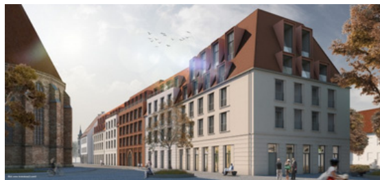
Marienkirchblick Große Oderstraße 25 2400 0009 2-Zimmer Wohnung 56,03 m 2