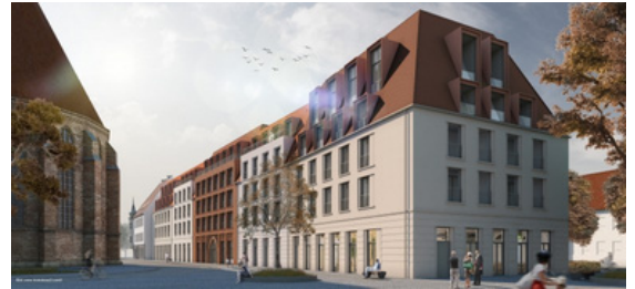
MarienKirchblick Große Oderstraße 26 2400 0012 4-Zimmer Wohnung 114,01 m 2