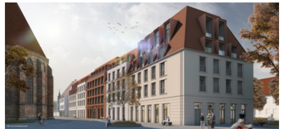
Marienkirchblick Große Oderstraße 26 2400 0014 4-Zimmer Wohnung 114,35 m 2