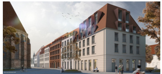
Marienkirchblick Große Oderstraße 26 2400 0017 2-Zimmer Wohnung 76,81 m 2

Nettomiete: 1.075,34 EUR Betriebskosten: 138,26 EUR Heizkosten: 138,26 EUR Gesamtmiete: 1.351,86 EUR Kautions: 3.226,02 EUR