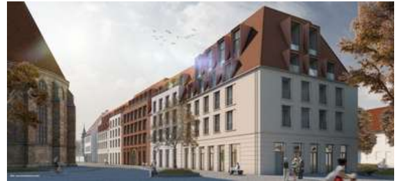
Marienkirchblick Große Oderstraße 27 2400.0022 2-Zimmer Wohnung 67,41 m 2