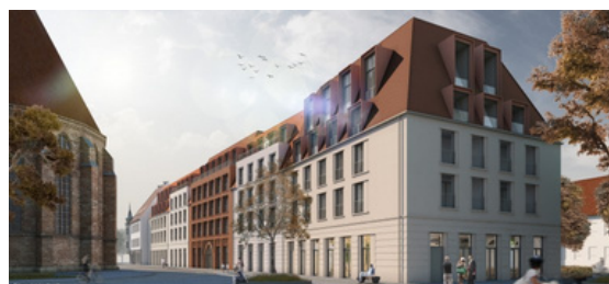
Marienkirchblick Große Oderstraße 27 2400 0023 3-Zimmer Wohnung 119,41 m 2

Nettomiete: 1.552,33 EUR Betriebskosten: 214,94 EUR Heizkosten: 214,94 EUR Gesamtmiete: 1.982,21 EUR Kautions: 4.656,99 EUR