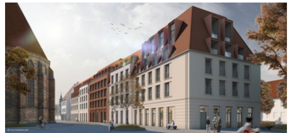
Marienkirchblick Große Oderstraße 27 2400 0026 3-Zimmer Wohnung 119,43 m 2