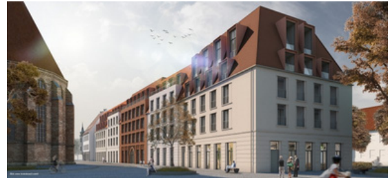
Marienkirchblick Große Oderstraße 27 2400 0027 2-Zimmer Wohnung 79,19 m 2

Nettomiete: 1.108,66 EUR Betriebskosten: 142,54 EUR Heizkosten: 142,54 EUR Gesamtmiete: 1.393,74 EUR Kaution: 3.325,98 EUR