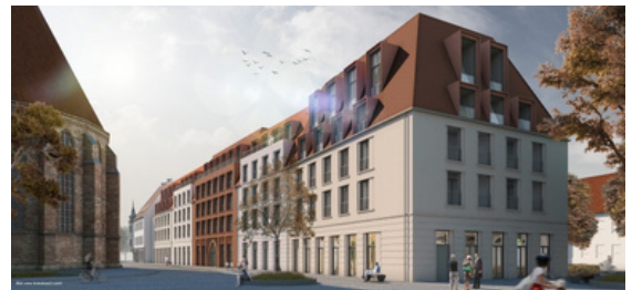
Marienkirchblick Große Oderstraße 27 2400 0028 2-Zimmer Wohnung 67,67 m 2