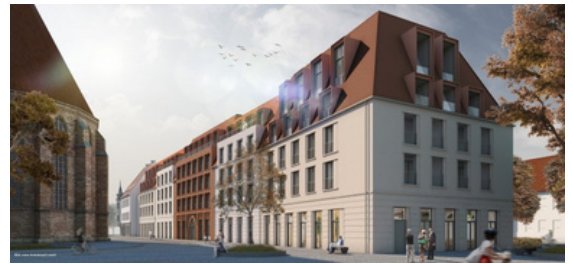
Marienkirchblick Große Oderstraße 27 2400 0029 3-Zimmer Wohnung 117,55 m 2