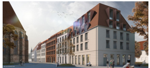
Marienkirchblick Große Oderstraße 27A 2400 0033 2-Zimmer Wohnung 78,91 m 2

Nettomiete: 1.104,74 EUR Betriebskosten: 142,04 EUR Heizkosten: 142,04 EUR Gesamtmiete: 1.388,82 EUR Kaution: 3.314,22 EUR