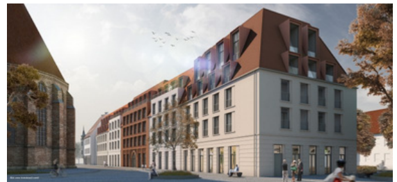
Marienkirchblick Große Oderstraße 27a 2400 0034 4-Zimmer Wohnung 113,84 m 2

Nettomiete: 1.479,92 EUR Betriebskosten: 204,91 EUR Heizkosten: 204,91 EUR Gesamtmiete: 1.889,74 EUR Kautions: 4.439,76 EUR