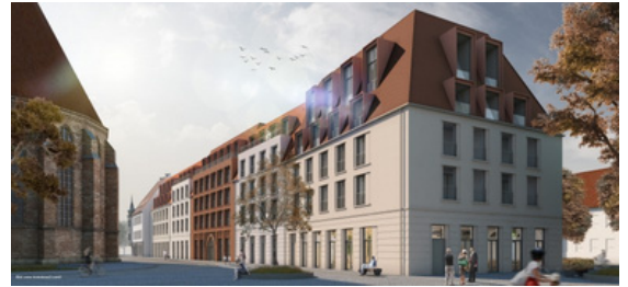
Marienkirchblick Große Oderstraße 27a 2400 0038 4-Zimmer Wohnung 111,78 m 2